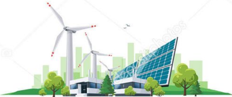
ENERGY FROM RENEWABLE SOURCES